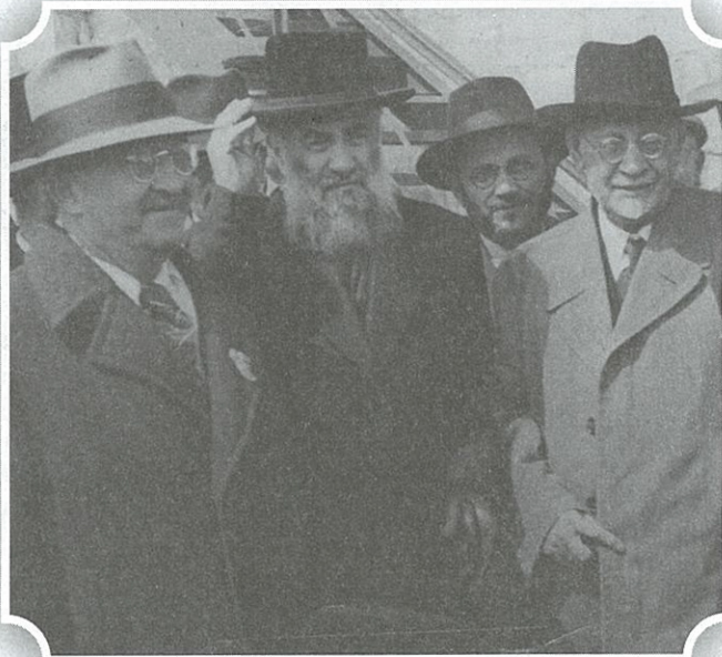
עם שר הדתות הראשון של מדינת ישראל, הרב י"ל הכהן מימון, לשמאלו