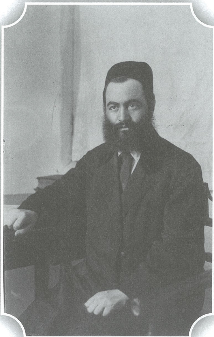
הרב יהושע קניאל בצעירותו